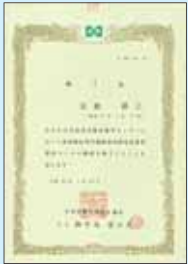
局所排気装置等設計コース修了証