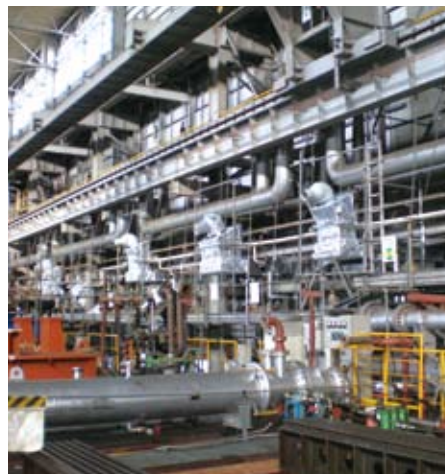
某機械メーカー(千葉県)