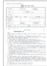
設置・移転・変更届け