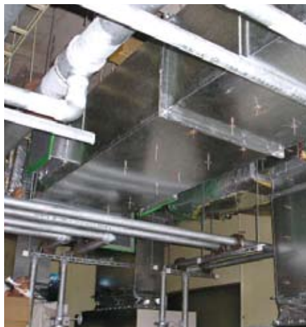
某電気部品工場(神奈川県)