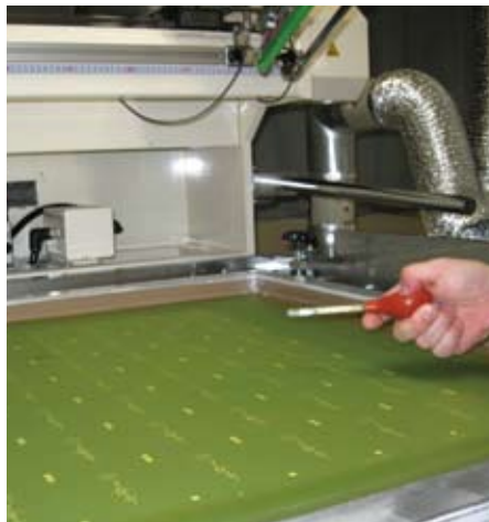
某印刷工場(東京都)