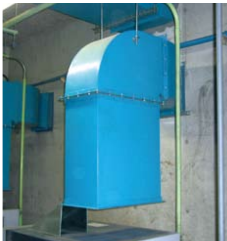
某建材メーカー(兵庫県)