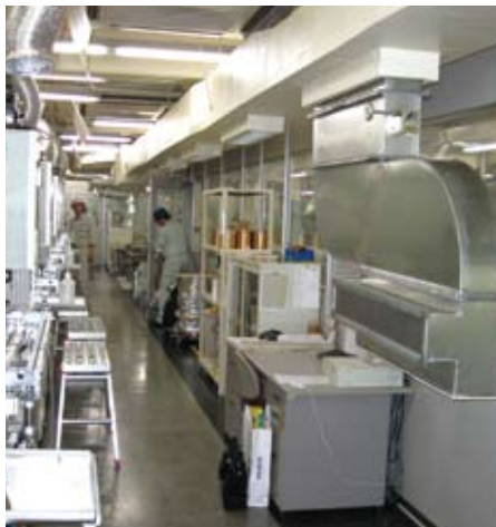
某印刷工場(東京都)