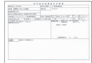
局所排気装置設計計算書